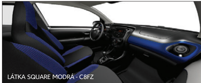
LÁTKA SQUARE MODRÁ - C8FZ