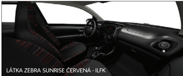
LÁTKA ZEBRA SUNRISE ČERVENÁ - ILFK