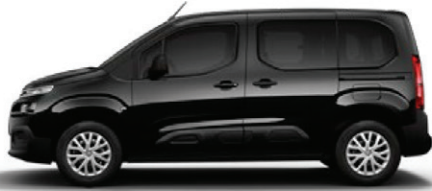
Černá PERLA NERA (M)