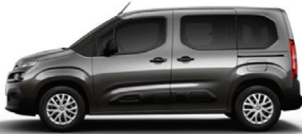
Šedá PLATINIUM (M)