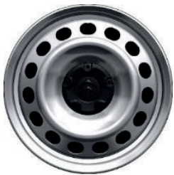
Kryt středu kol