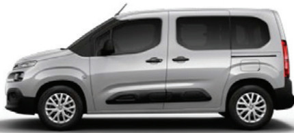
Šedá ARTENSE (M)