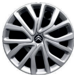
Okrasný kryt TWIRL R16 - černý střed