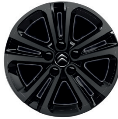
Hliníkový disk (celo-černý) STARLIT R16