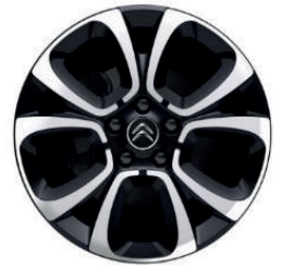
Hliníkový disk SPIN R17