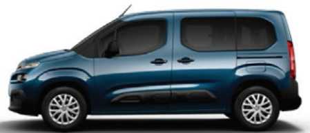
Modrá DEEP (M)