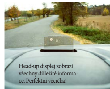
Head-up displej zobrazí všechny důležité informace. Perfektní věcička!