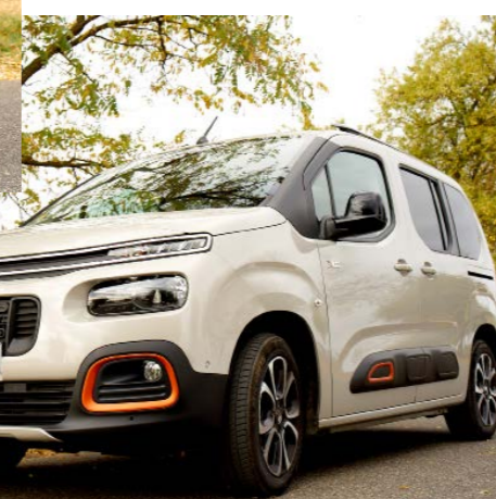
S dětmi určitě oceníte vysouvací dveře. A jízda v berlingu? Plynulá, pohodlná, odhlučněná. Konečně „pořádný kočár“!